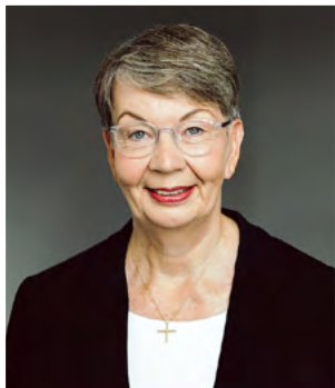
Landesbischöfin Kristina Kühnbaum-Schmidt Landesbischöfin der Evangelisch-Lutherischen Kirche in Norddeutschland und EKD-Schöpfungsbeauftragte